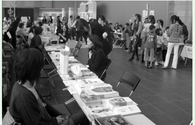
今年3月23日、岡山デジタルミュージアムで開かれたCBF。岡山・香川の女性起業家による25のプレゼンショップが出店。交流会なども盛況だった

当日は、化粧品やアクセサリ、ネイルアートなど女性を対象にした女性起業家らのアンテナショップや、コラボレートによる新商品のパウンドケーキを出すカフェなどがオープン。先輩女性起業家によるセミナーや名刺交換会には120人が参加しました。