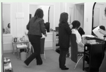
▲▶ヘアメイクの専門家やプロカメラマンを招き、より美しくセンスアップし、効果的にアピールする術を学んだ